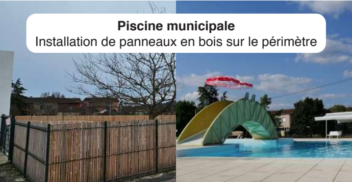
Piscine municipale Installation de panneaux en bois sur le périmètre