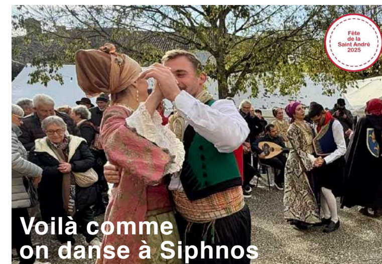
Voilà comme on danse à Siphnos

Monflanquin, une bastide qui traverse le temps ouverte au monde