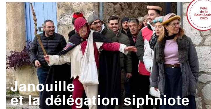
Janouille et la délégation siphniote