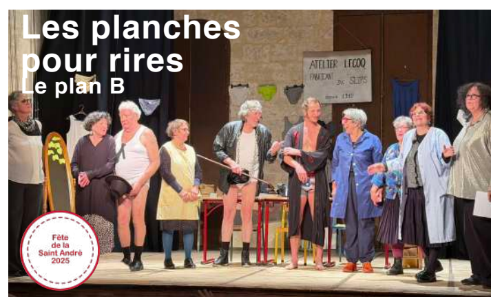
Les planches pour rires Le plan B