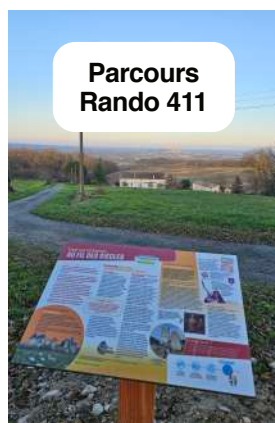
Parcours Rando 411

Le salon de toilettage BEAUTY DREAM , ouvrira ses portes le 14 février au 59 avenue de la Libération, à la place de la fleuriste. Contact : 07 44 18 98 27