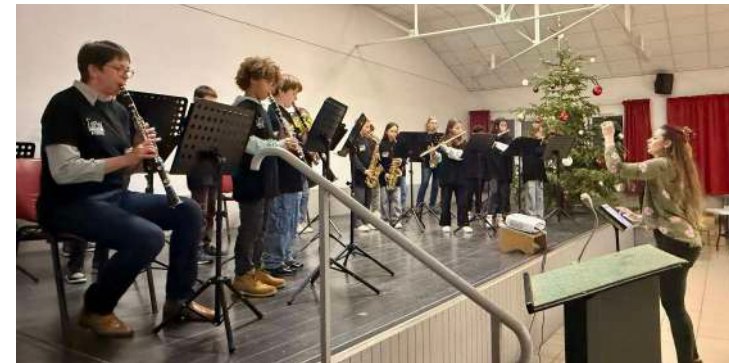
Orchestre A l'École

Merci de les encourager par vos applaudissements.