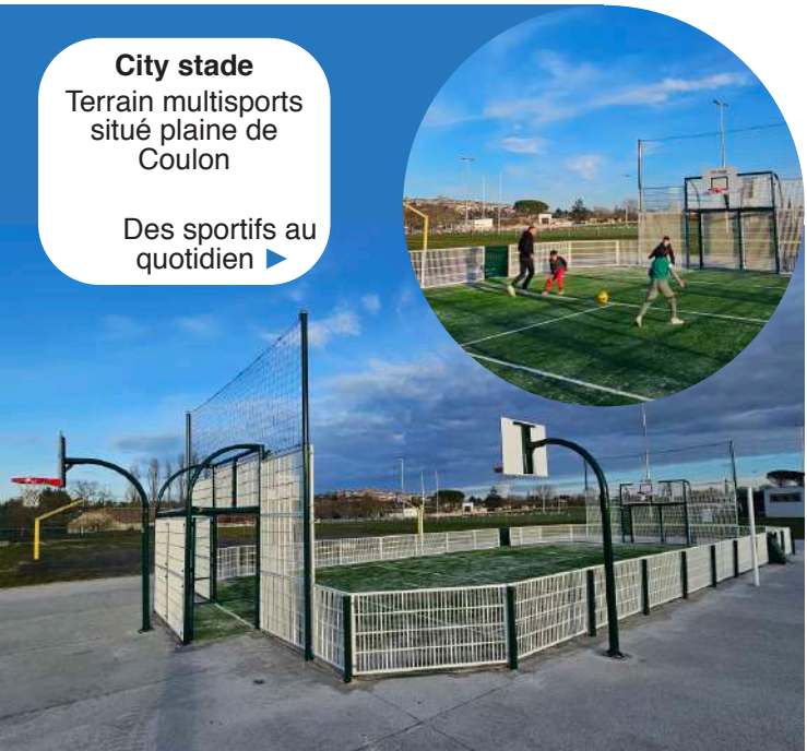
City stade Terrain multisports situé plaine de Coulon