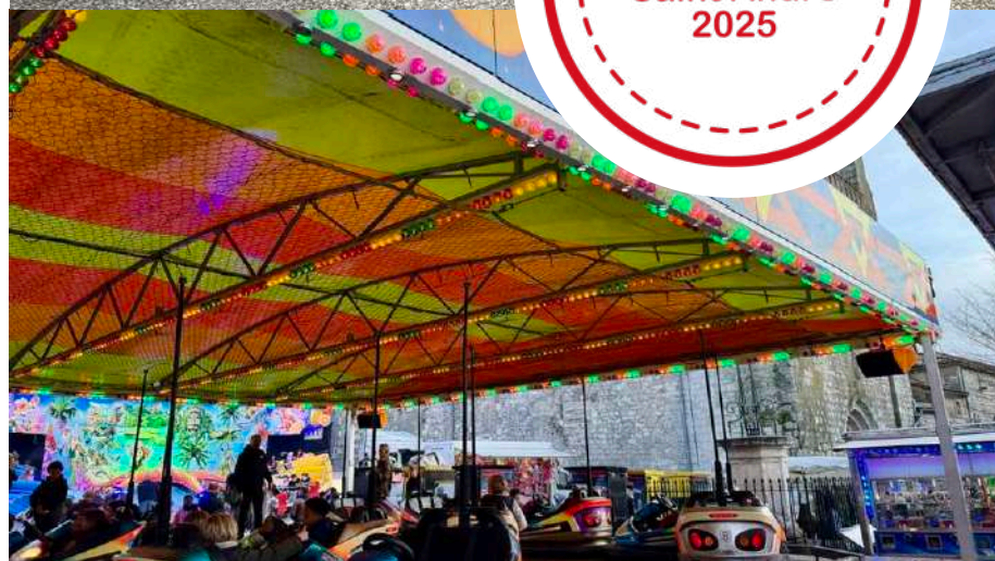
Saint André - Danse Siphniote et Fête foraine