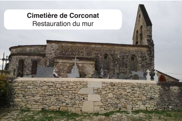
Cimetière de Corconat Restauration du mur

La commune de Monflanquin compte 8 cimetières , véritables témoins de notre histoire locale. Un important travail a été mené ces dernières années : mise à jour des plans, recensement d'environ 1 000 sépultures et actualisation des dossiers de concessions , avec l'aide précieuse des habitants.