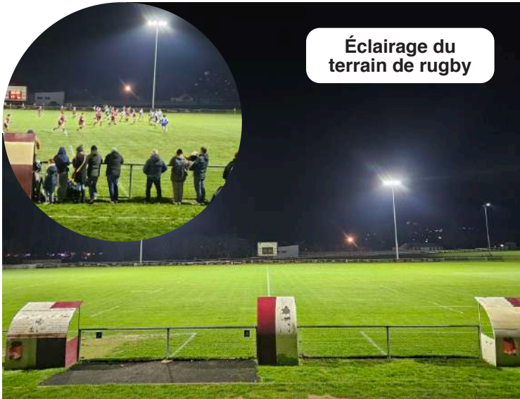
Éclairage du terrain de rugby

Ces travaux, d'un montant d'environ 200 000 € , ont été financés grâce au soutien de la CCBHAP (40 000 €) et du Syndicat TE 47 (85 000 €) . Le reste à charge pour la commune , inférieur à 75 000 € , est étalé sur 5 ans .