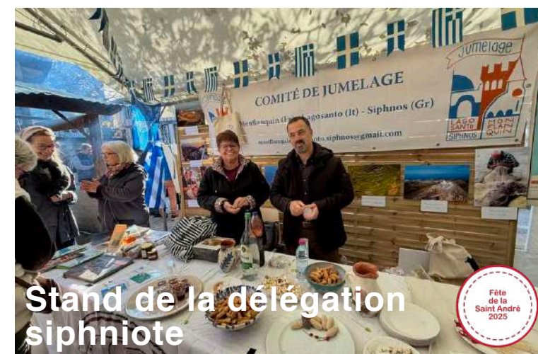
Stand de la délégation siphniote

Monflanquin, une bastide qui traverse le temps ouverte au monde