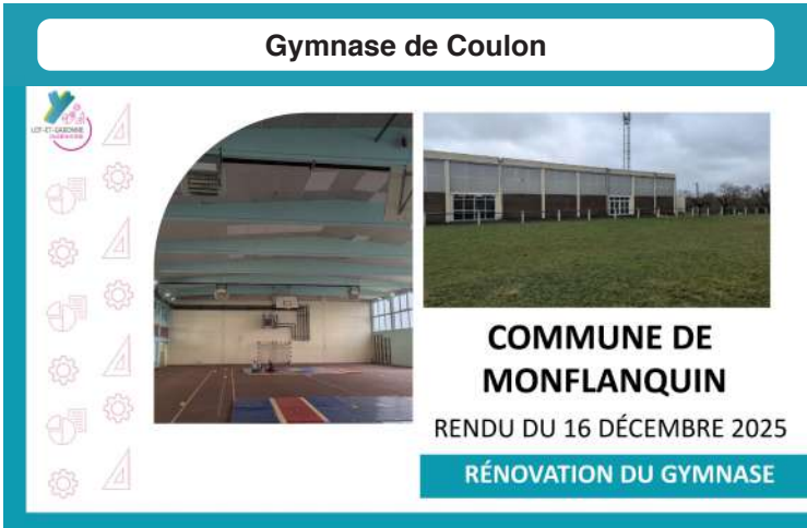
Gymnase de Coulon