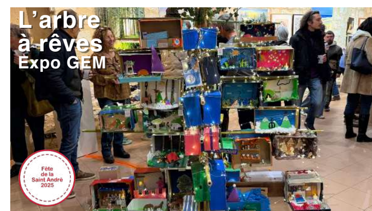
L'arbre à rêves Expo GEM