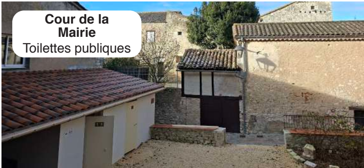
Cour de la Mairie Toilettes publiques