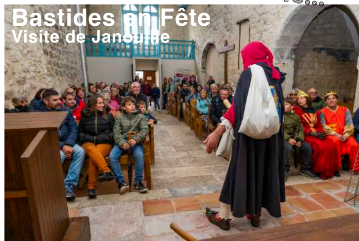
Bastides en Fête Visite de Janouille