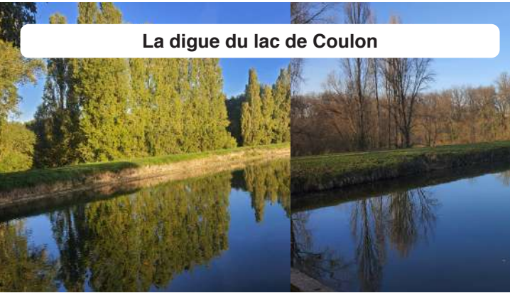
La digue du lac de Coulon

Les autorités préfectorales et la DDT (Direction Départementale des Territoires) nous ont demandé dans le cadre du classement du lac de Coulon de nous mettre en conformité avec la réglementation des lacs.