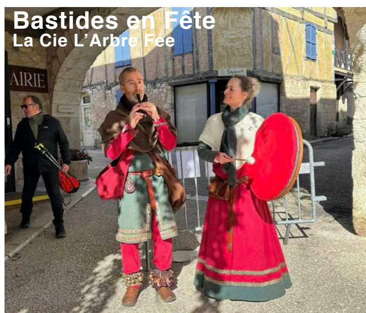
Bastides en Fête La Cie L'Arbre Fée