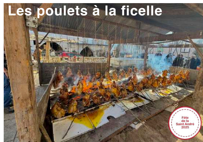
Les poulets à la ficelle

Monflanquin, une bastide festive, familiale et gourmande