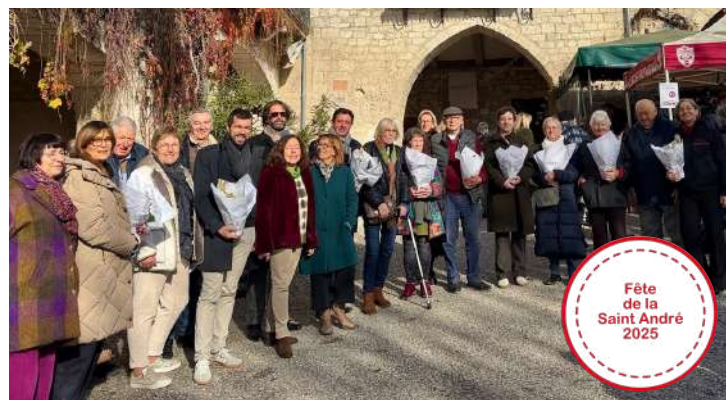
Remise des prix du concours des maisons fleuries