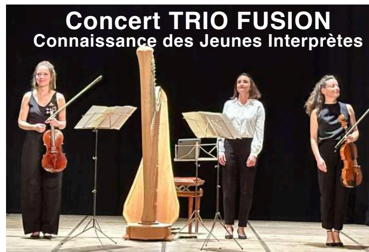
Concert TRIO FUSION Connaissance des Jeunes Interprètes