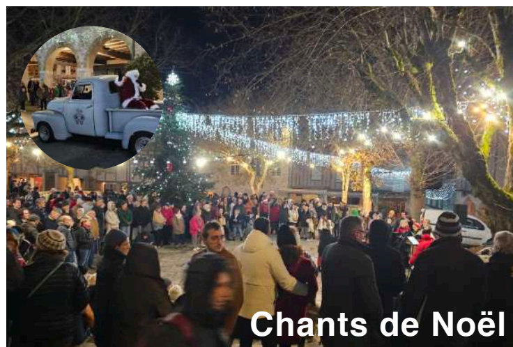
Chants de Noël