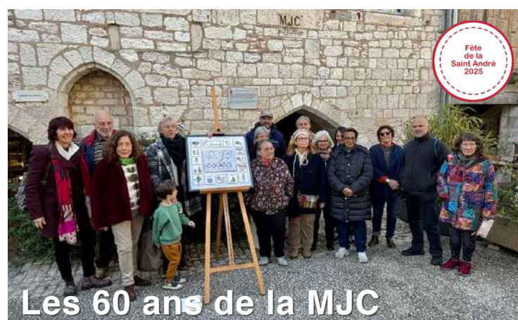
Les 60 ans de la MJC