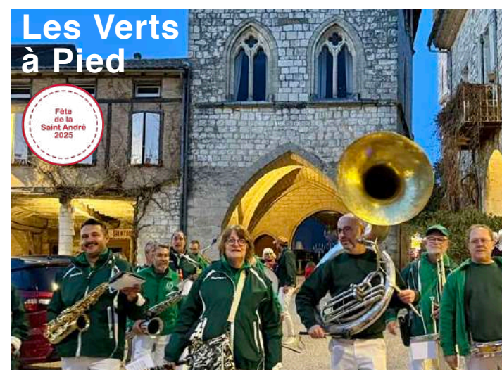
Les Verts à Pied