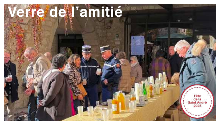
Verre de l'amitié