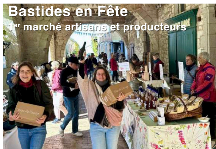
Bastides en Fête 1 er marché artisans et producteurs