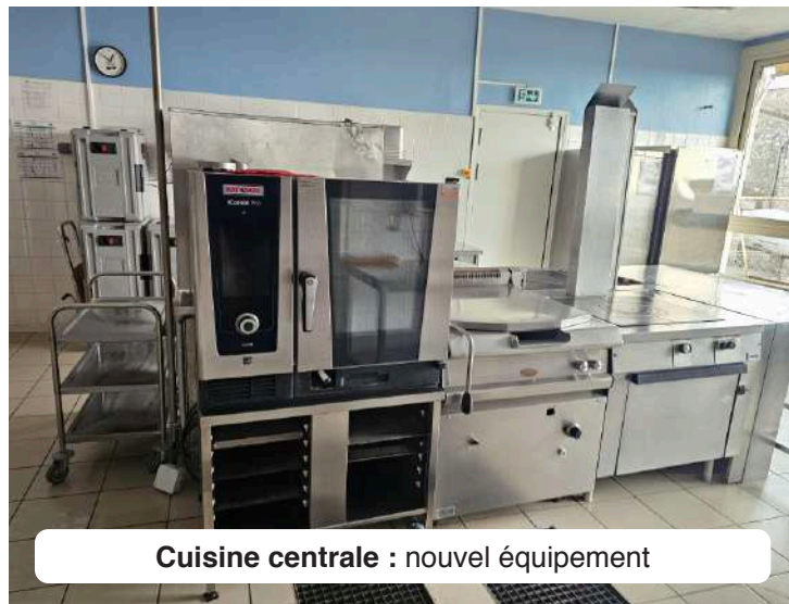
Cuisine centrale : nouvel équipement

Le restaurant scolaire est agréé en tant que cuisine centrale , ce qui permet l'exportation des repas vers les services de la Communauté de communes (centres de loisirs et crèche).